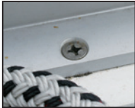
VA-Schraube in Alu-Fussreling