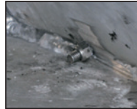
VA-Schrauben in Alu-Schweißnaht