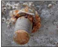
Korrodierte VA-Schraube in Alu