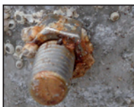
Rjavenje jeklenih vijakov na aluminiju