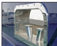
Inox izdelki pritrjeni na zunanjih delih plovila

TIKAL TEF-GEL® je vodoodporna zmes na osnovi PTFE. Je izvrstna zaščita pred rjavenjem med različnimi kovinami. Vsepovsod kjer se stikate dve kovine je priporočljivo dodati le kanček TIKAL TEF-GEL® -a, in problem pred rjavenjem je odveč in odpravljen.