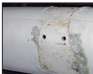
Korozija na jamboru