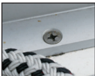
Jekleni vijaki v aluminijasti hojnici