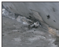
Jekleni vijaki v varu