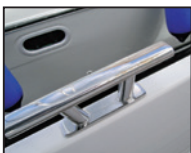
Pritrjevanje inox izdelkov na okvirje iz aluminija